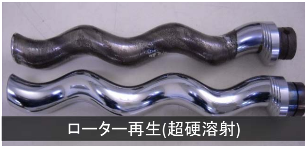
ローター再生(超硬溶射)