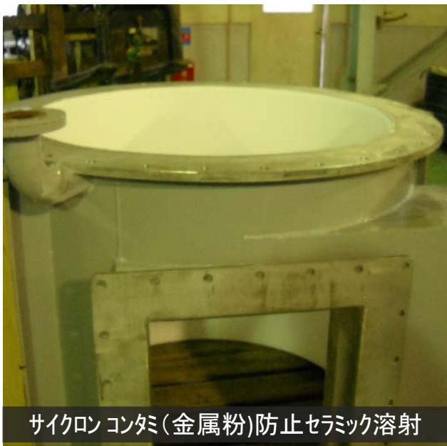
サイクロンコンタミ(金属粉)防止セラミック溶射