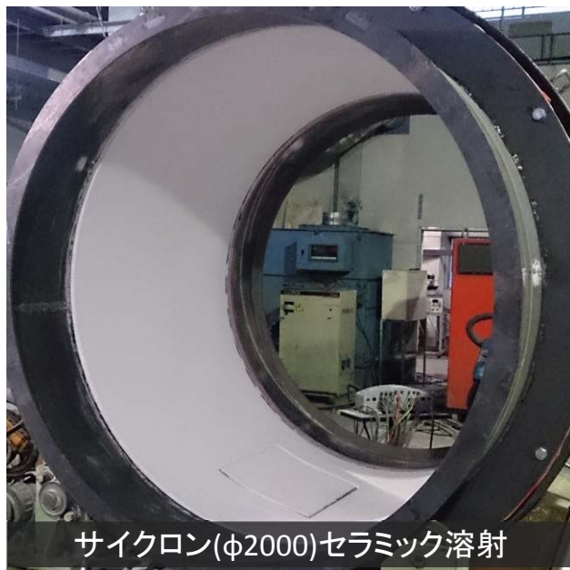
サイクロン(φ2000)セラミック溶射