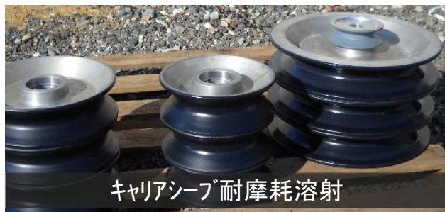
キャリアシーブ耐摩耗溶射