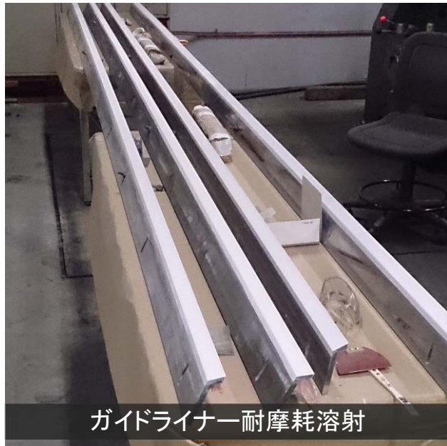
ガイドライナー耐摩耗溶射