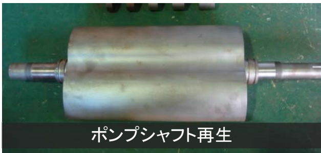
ポンプシャフト再生